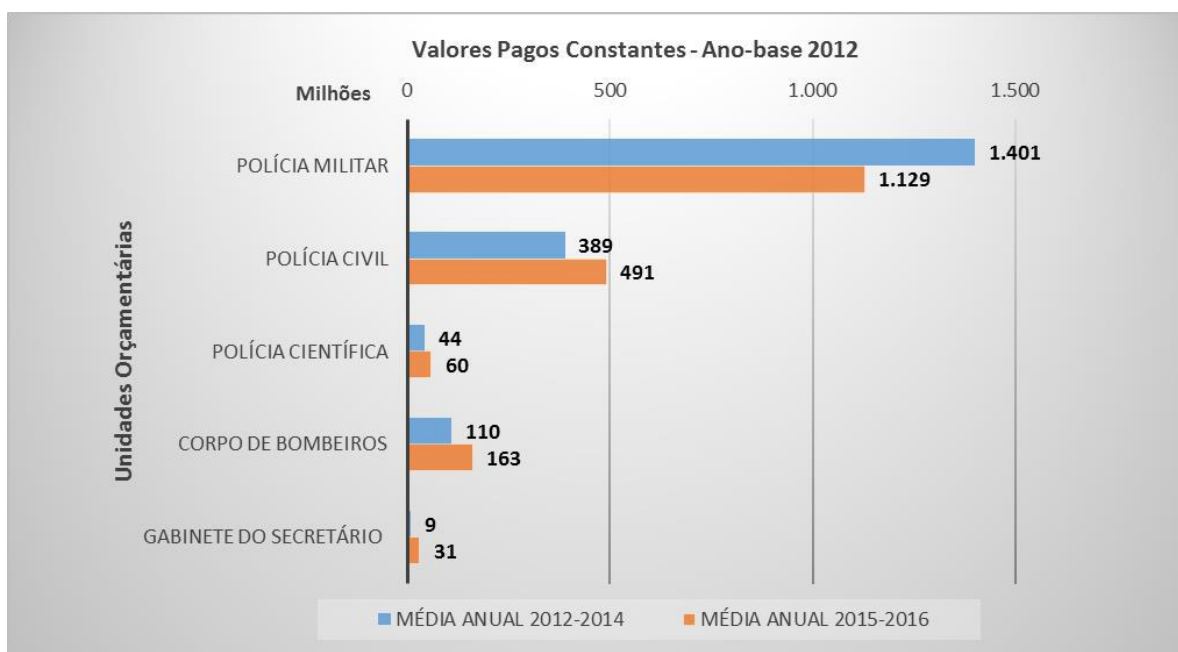
Figura 3 - MÉDIA ANUAL DE GASTOS POR UNIDADE (2012-2016)

Contudo, o dado mais relevante é a queda de quase 20% da média anual de gastos da PMPR observada no período 2015-2016 em relação ao período anterior, em tendência oposta às demais unidades, com destaque para a verba do Gabinete do Secretário, que teve significativos 229,1% de incremento no mesmo período.